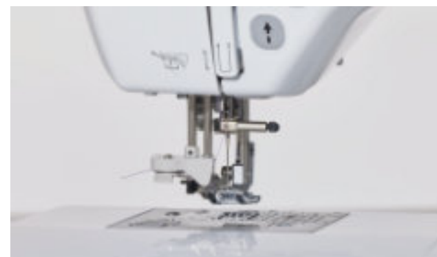
Komfortní navlékač nitě do jehly