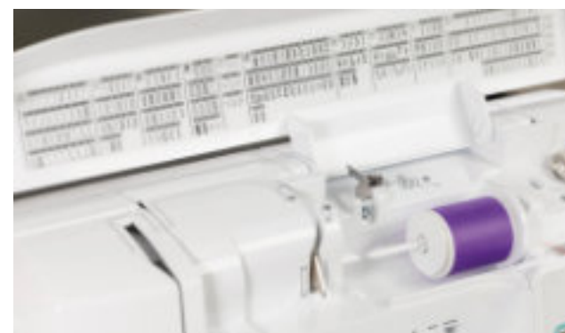
241 vestavěných šicích a vyšivacích stehů