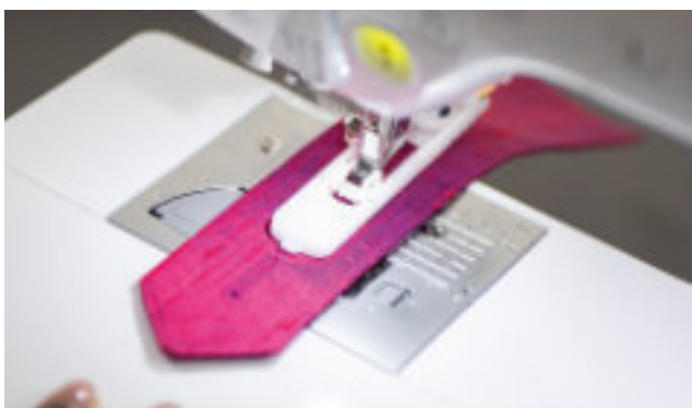
Automatická knoflíková dírka